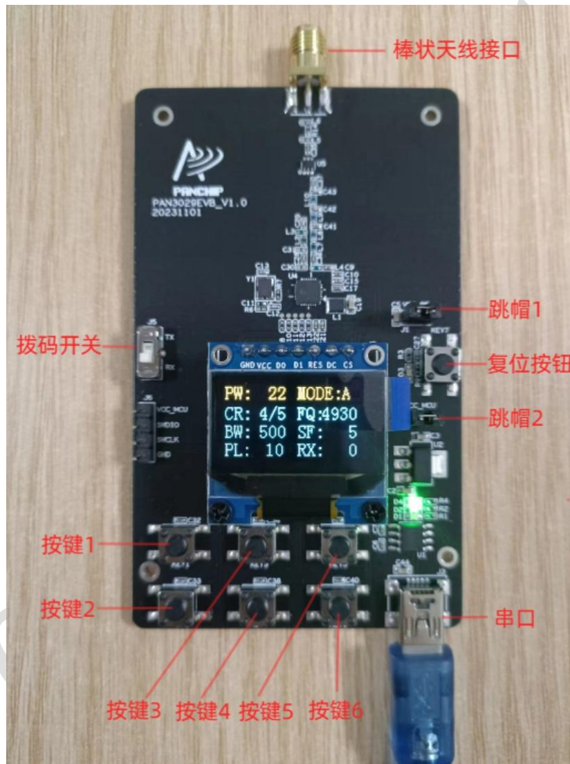
图 2-1 HC32 底板